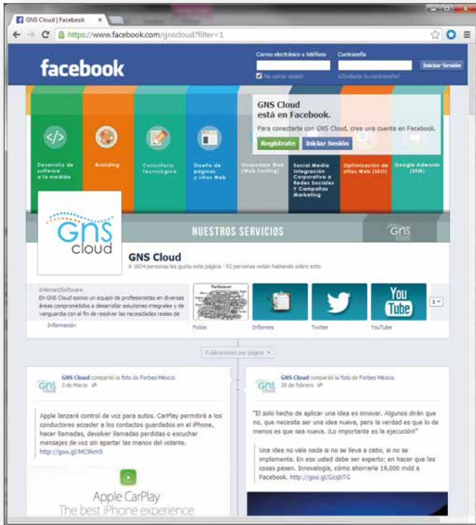
Ejemplo de Identidad Corporativa de una Página de Facebook.

Es necesario realizar muchas tareas técnicas (lo que hacemos en GNS Cloud) tales como: